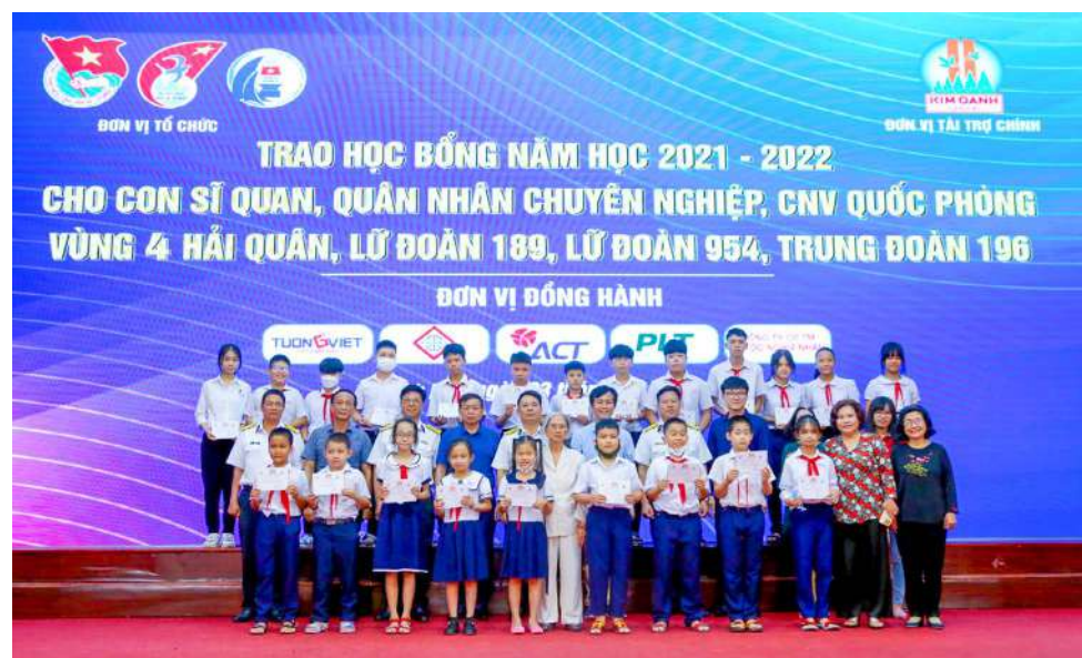
Ngoài ra, Quỹ là đơn vị đồng hành cùng Quỹ Học bổng

- Phối hợp các đơn vị chức năng tổ chức chăm lo sức khỏe, khám chữa bệnh miễn phí cho cán bộ, chiến sĩ, lực lượng làm nhiệm vụ