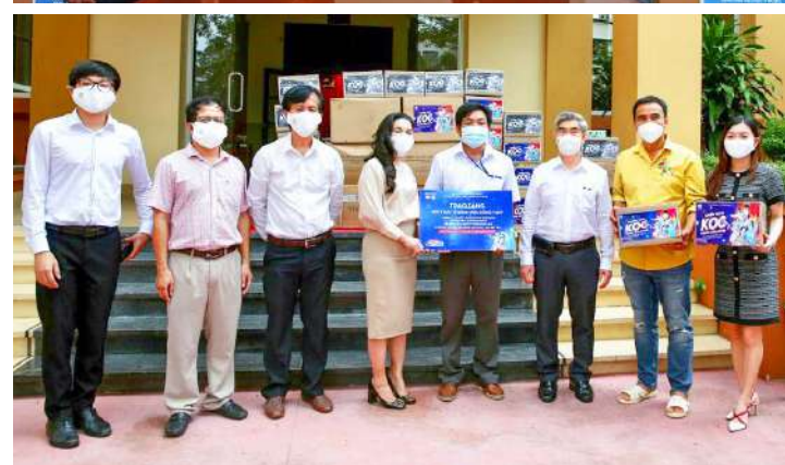
Quỹ Từ thiện Kim Oanh không ngại khó, hỗ trợ người dân, đội ngũ y tế, bệnh viện đẩy lùi dịch Covid-19

Song song với các hoạt động chính là trao tặng máy thở và vật tư trợ thở, oxy thở cho các bệnh viên và cơ sở y tế, Chương trình cũng dành sự quan tâm và thăm hỏi đến lực lượng chiến sĩ, tình nguyện viên và đội ngũ phóng viên báo đài đang thực hiện nhiệm vụ nơi tuyến đầu. Gửi thư thăm hỏi và gửi tặng những phần quà gồm trang phục bảo hộ, khẩu trang y tế, kit xét nghiệm và các vật tư y tế trang bị cá nhân giúp các lực lượng tuyến đầu đảm bảo sức khỏe, an toàn để thực hiện nhiệm vụ, cùng cả nước đẩy lùi dịch bệnh.