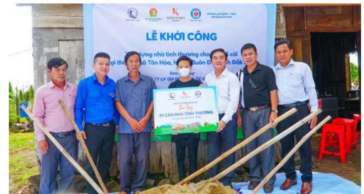
Trao tặng căn nhà tình thương trị giá 60 triệu đồng cho trẻ mồ côi, khó khăn tại xã Tân Hoà, huyện Buôn Đôn, tỉnh Đắk Lắk

Nhằm chăm lo đời sống người dân và chia sẻ trách nhiệm với địa phương, ngoài việc phát triển các dự án chất lượng nhằm nâng cao đời sống của người dân địa phương và hỗ trợ người thu nhập thấp có cuộc sống ổn định (của Tập đoàn Địa ốc Kim Oanh) thì Quỹ cũng luôn dành nhiều sự quan tâm đến các hoạt động hướng đến giải quyết các vấn đề an sinh xã hội tại các địa phương. Với hàng trăm nhà tình nghĩa, nhà tình thương, cầu đường đã được xây dựng; hàng nghìn phần quà cứu trợ lũ lụt, mưa bão và giúp đỡ các hoàn cảnh khó khăn; và rất nhiều các hoạt động chăm sóc sức khỏe, xây dựng các công trình cộng đồng được thực hiện suốt từ năm 2009 đến nay. Cụ thể: