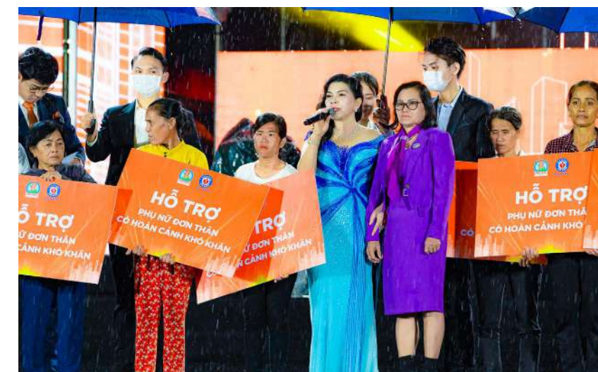
Kim Oanh Group hỗ trợ những hoàn cảnh khó khăn tại chương trình tri ân khách hàng Century City, Long Thành, Đồng Nai

tim trẻ thơ. Qua kết nối, tìm hiểu và đồng hành, Quỹ đã tài trợ kinh phí thực hiện thành công 06 ca mổ tim cho các em có hoàn cảnh gia đình khó khăn. Ngoài các hoạt động chăm sóc và bảo vệ trẻ em ở mảng hoạt động giáo dục như xây nhà bán trú cho trẻ em vùng cao, xây bếp ăn tại các điểm trường, Quỹ còn thực hiện 09 công trình sân chơi thiếu nhi tại các địa phương vùng nông thôn của các tỉnh: Hưng Yên, Quảng Trị, Thừa Thiên Huế, Bình Dương, Đồng Nai và nhiều các Chương trình, sân chơi vui Tết Trung thu, Tết Thiếu nhi và các dịp lễ lớn trong năm. Song song với các chương trình, phần việc hướng đến chăm sóc và bảo vệ trẻ em, Quỹ luôn có nhiều chương trình ý nghĩa hướng đến thúc đẩy quyền bình đẳng nữ giới và hỗ trợ phụ nữ nghèo vươn lên phát triển kinh tế.