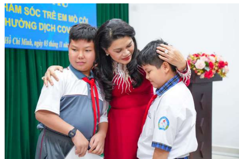
Quỹ từ thiện Kim Oanh nặng tình với Mẹ đỡ đầu, chú trọng với hoạt động vì sự phát triển của trẻ em.

Hưởng ứng lời kêu gọi của Trung ương Hội Liên hiệp Phụ nữ Việt Nam trong chương trình Mẹ đỡ đầu, Quỹ đã cam kết hỗ trợ 2.500.000.000 đồng đỡ đầu, tài trợ học bổng học tập cho 40 trẻ em mồ côi trên địa bàn 03 tỉnh, thành: Bình Dương, TP. Hồ Chí Minh, Đồng Nai với tổng kinh phí đã giải ngân trong năm 2022 là 560.000.000 đồng.