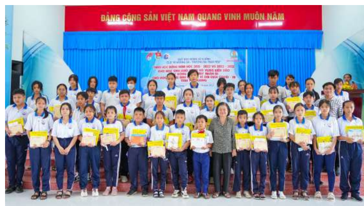
Nguyên Phó Chủ tịch nước Trương Mỹ Hoa, Chủ tịch Học bổng Vừ A Dính chụp lưu niệm cùng các cháu học sinh tại Bến Tre

Vào ngày 17/12/2022 vừa qua tại khách sạn Rex, Quận 1, TP. Hồ Chí Minh, Quỹ và Quỹ Học bổng Vừ A Dính đã thực hiện ký kết thỏa thuận tài trợ giai đoạn 2023 - 2024 trao tặng học bổng thường niên cho học sinh miền núi, dân tộc thiểu số với tổng số tiền là 1.000.000.000 đồng. Đây là hoạt động thường niên và được Ban Lãnh đạo Quỹ quan tâm, đầu tư, đóng góp thiết thực cho sự phát triển nguồn nhân lực trẻ của miền núi, vùng đồng bào dân tộc thiểu số.